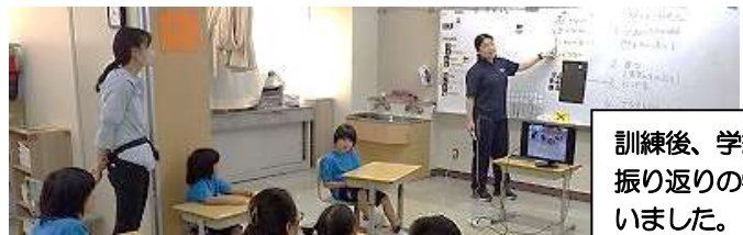
訓練後、学級ごとに振り返りの学習を行いました。