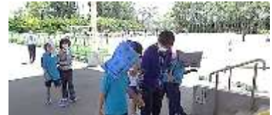
防災頭巾をかぶって、落ち着いて避難することができました。

6月20日(火)に地震を想定した避難訓練を行いました。お隣の不二が丘小学校との合同訓練で、今回は、大きな地震が続けて2度起き、途中から放送機器が使えなくなったという想定のもと取り組みました。名取が丘校では、普段から使用しているトランシーバーを駆使しながら連絡を取り合いました。子供たちは事前の学習を生かし、教師の指示をきちんと守って避難することができました。